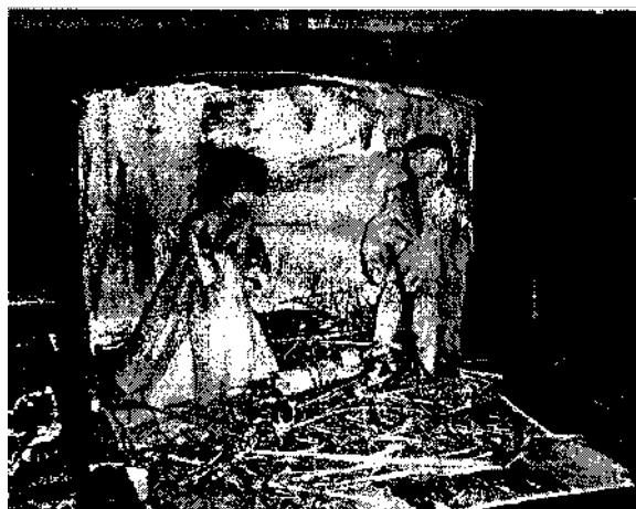
A komáromi betlehemi jászol kiállítás képeiből