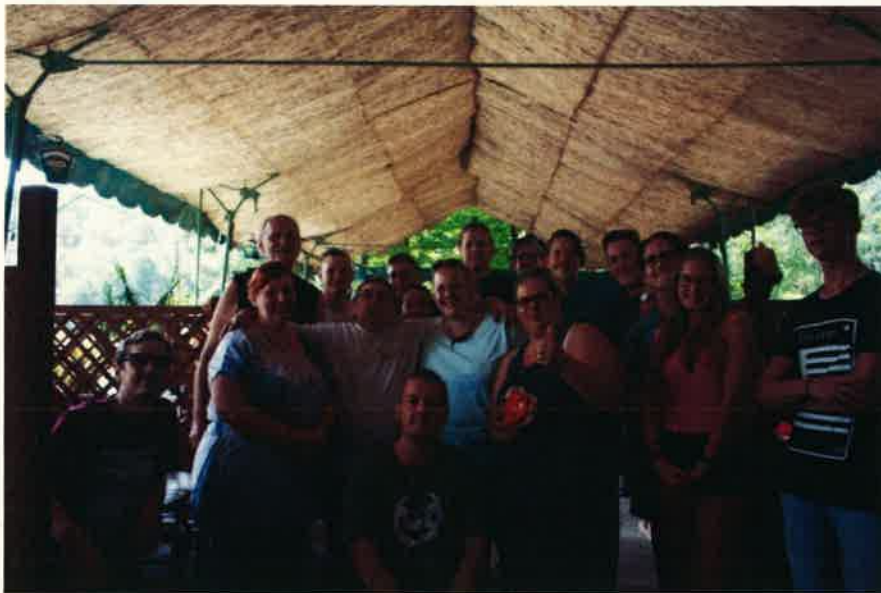
A szállásadóinkkal, akik szerint régen volt ilyen jó kis csapatuk

Galéria a tábori történésekkel: http://www.jamk.hu/galeria/index.php?/category/702