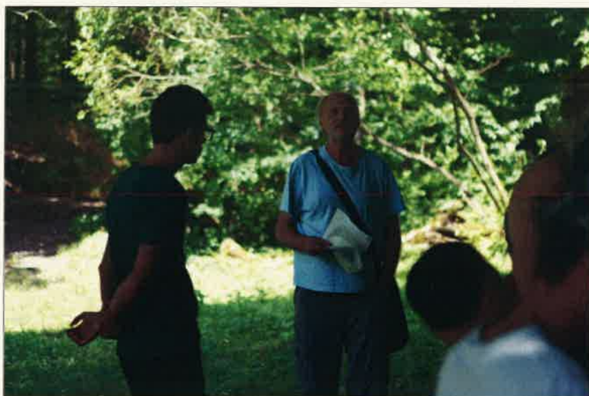
A könyvtár kimegy a természetbe

ösvényen. Bevetettük magunkat az erdő kellős közepére. Több megállót és próbát is kiálltunk ott. Csöndben hallgattuk az erdő esti hangját, majd egyenként is megtettünk egy jó darab távolságot, leküzdve félelmeinket. Végül a kétórás túrát követően, kiérve egy tisztásra, az éjszakai csillagokban gyönyörködtünk. Megismerkedtünk a nyári esti csillagképekkel. Az erdőben talált gombákról is esett szó: róka-gombát, özlábat, gerebengombát találtunk. Ezeket másnap délelőtt behasonlítottuk az általunk hozott gombahatározóban. Megállapítottuk, hogy nem árt javítani kozmikus világképünkön sem. A könyvtárak számos csillaghatározót kínálnak, hogy jobban el tudjunk igazodni, de a régi korokban, amikor még nem álltak rendelkezésre navigációs eszközök, a csillagállások alapján tájékozódott az emberiség.