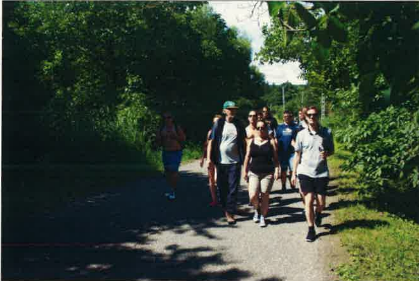
A Börzsöny szívében

Esti körünkben az Agenda 2030 pontjai közül az élethosszig tartó tanulástól, a nemek közti egyenlőségről és a nap témájáról, a vízhez és tisztaságához való viszonyunkról beszélgettünk.