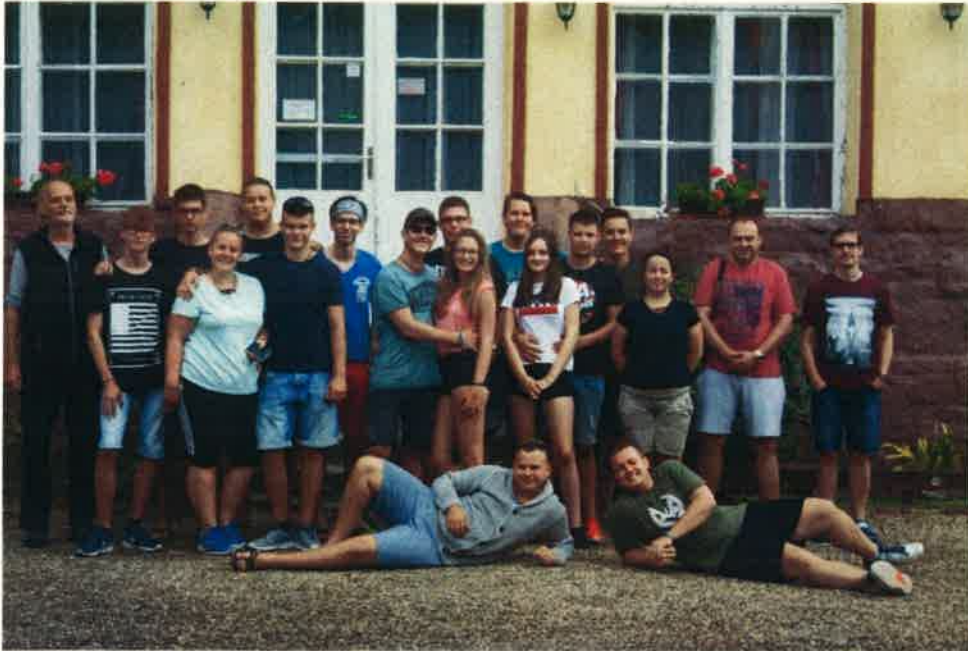
Zárókép a Kisinóci turistaház előtt