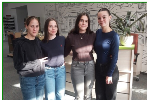
Majd Rákeresünk! csapat

Gratulálunk a csapatoknak és köszönjük a Majki Népfőiskolai Társaság és a Hétvezér Egyesület munkatársainak a szervezést!