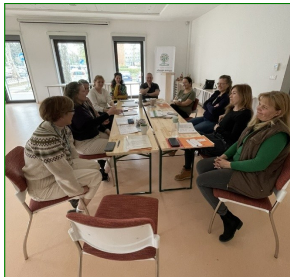
Kis csapatunk ☺

dés/kétely esetén van kihez fordulni, megerősített bennünket az elkötelezettségünkben. A vállalt kihívásainkat (pl. elhagyni az öblítőt, kevesebb konzervet venni/enni) szem előtt tartva folytatjuk az életünket, és bízunk benne, hogy tanácsainkkal a jövőben mások számára is segítséget tudunk majd nyújtani, hogy elhagyják a vegyszereket és dédanyáink módszereihez visszatérve újra természetes alapanyagok felhasználásával takarítsanak, öltözködjenek, és persze kevesebb műanyagot termeljenek.