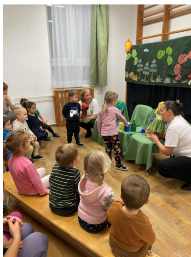
Bajnai Zöld Tündérek Héregen

Megragadva a hét tematikáját több helyszínen is zajlott a társasjátékozás, valamint volt vetélkedő és kézműveskedés a négy elemhez kapcsolódóan. A Zene Világnapján Neszmélyen az iskola diákjai adtak koncertet, míg Keszölcön az időseket köszöntötték egy dalsokorral.